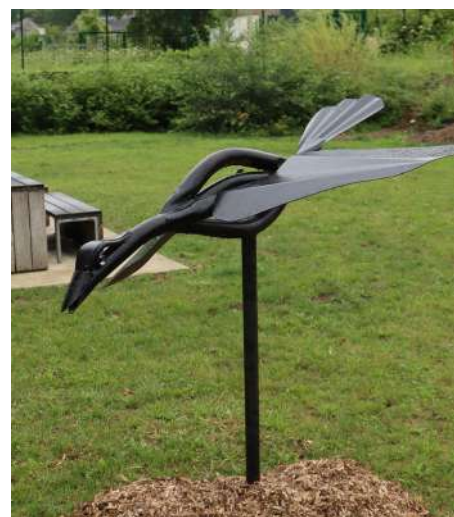
Exemple de réalisation métallique des services techniques

fresques situées dans le centre, ce sont d'autres productions artistiques qui prendront place dans notre commune avec l'implantation de plusieurs créations métalliques originales qui seront visibles dans les différents quartiers de la ville. Pour admirer la cité, rien de mieux que de prendre un peu de hauteur. De ce fait, trois points de vue seront réalisés au niveau de la stèle de Jean-Marie Perrod, de la Roche à l'église et du secteur du Maroc.