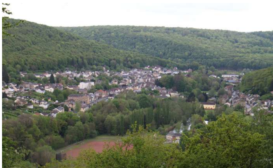
Point de vue secteur du Maroc