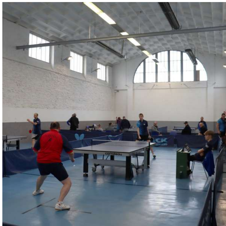
Trois salles sportives bénéficieront d'un nouvel éclairage Led : le COSEC, le TCN et ici en illustration l'USN

La Ville va consacrer près de 300 000€ pour répondre aux enjeux climatiques. La moitié vise