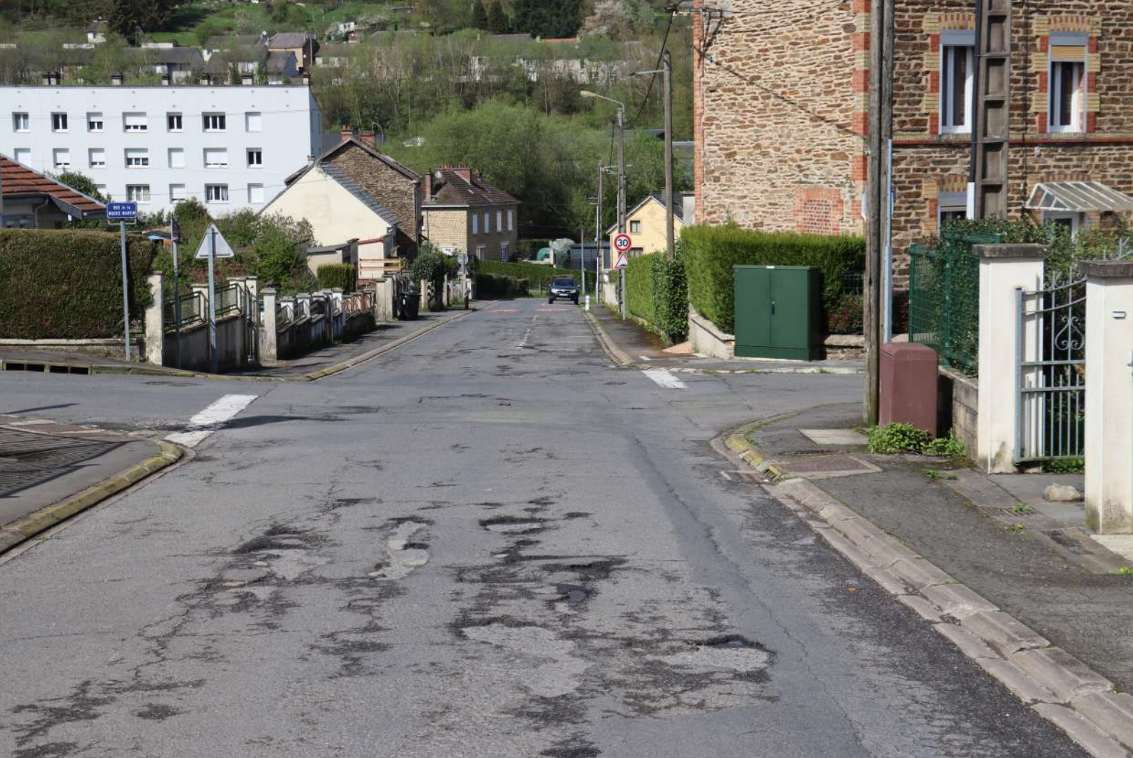
La rue Jean Moulin va bénéficier d'une profonde rénovation