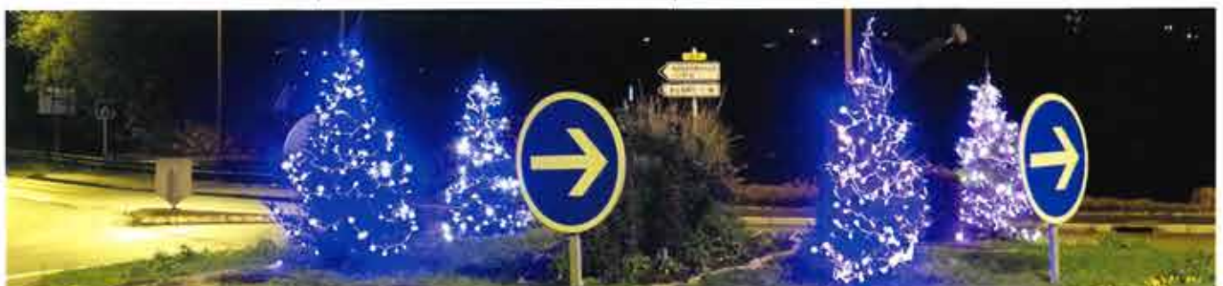
Rond-point rue Jean Roger