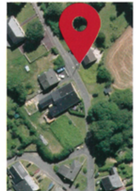
Rue des Tilleuls

• Rénovation de la place du Souvenir Français.