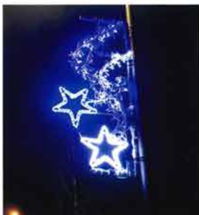
Place du Souvenir Français