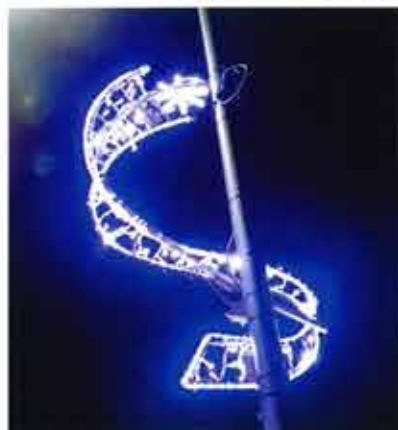
Illuminations sur le pont