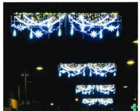
Rue Jules Fuzellier