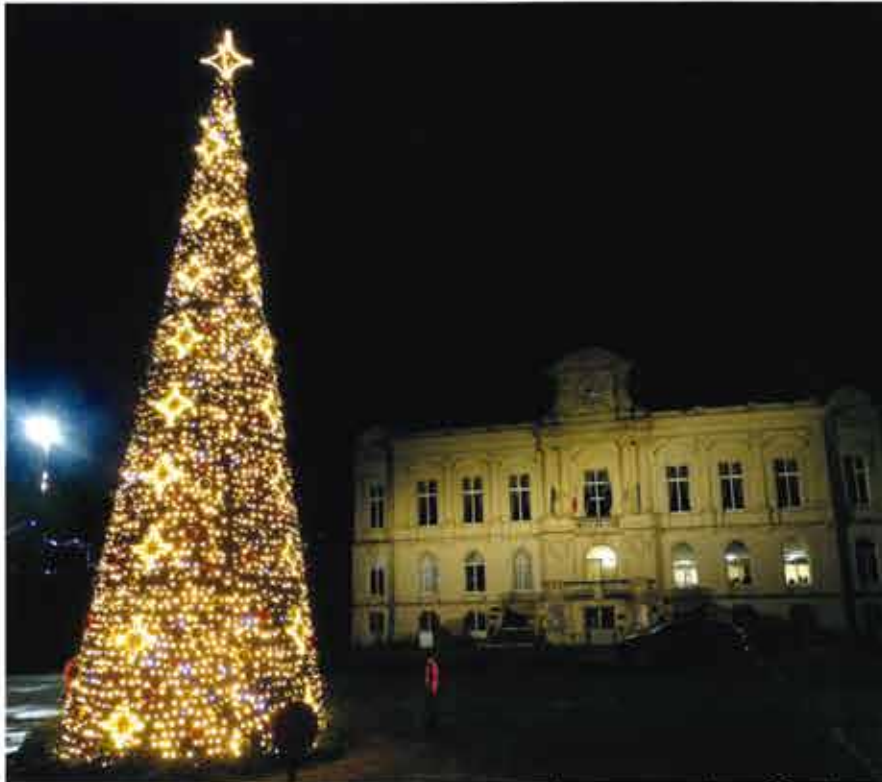
Le sapin - place Cambetta